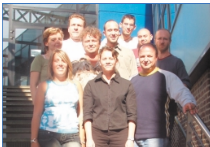
> L'équipe d'AMATSPORT