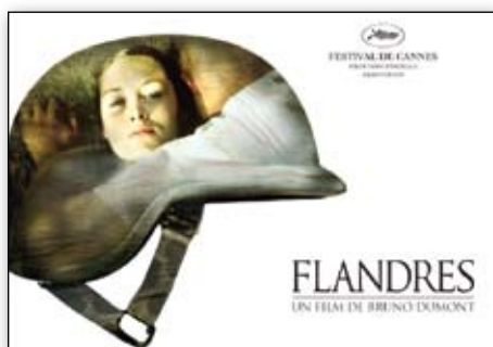
Flandres de Bruno Dumont